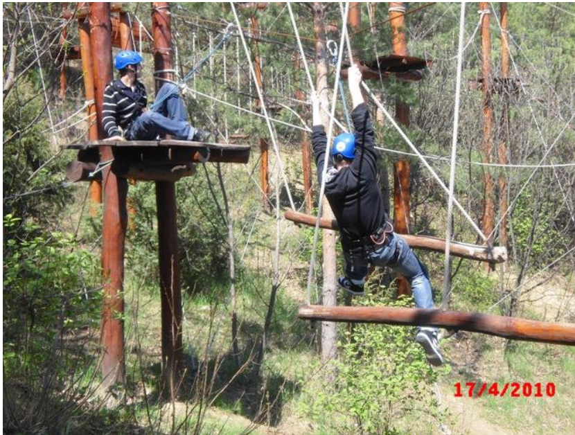
W parku linowym

Zorganizowano także dla młodzieży wycieczkę rowerową do benedyktyńskiego opactwa Pannonhalma związaną ze zwiedzaniem tego miejsca kultu religijnego, przechowującego pamiątki początków państwa węgierskiego.