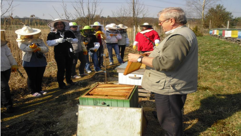
W pasiece w Maszkowie

Wycieczki do Słupska, Malborka, Gdańska i Sopotu połączone były ze zwiedzaniem zabytków kultury polskiej, do Słowińskiego Parku Narodowego, do Domu Chleba w Ustroniu Morskim – tam uczniowie mogli nauczyć się jak wypiekać chleb starodawnym sposobem, do wytwórni lodów.