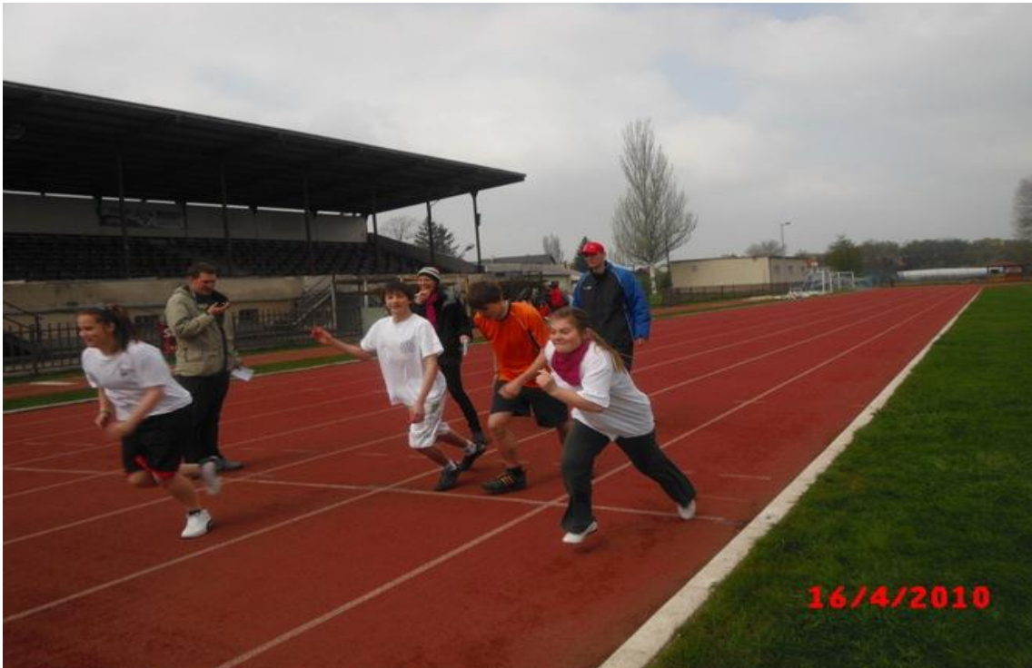
Zawody lekkoatletyczne na stadionie Bałtyk w Koszalinie